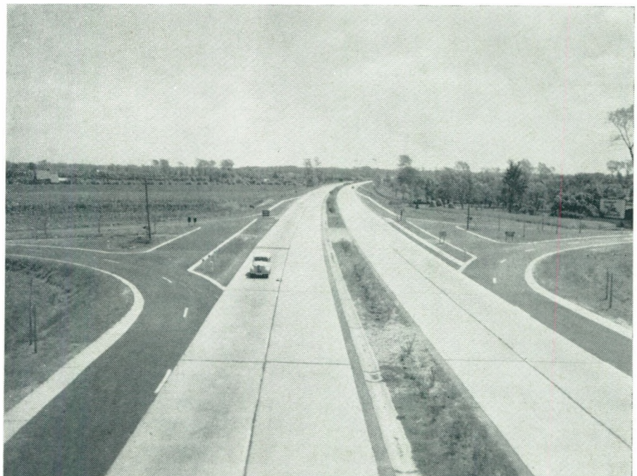
VERKEER Autosnelweg, oprit te Jabbeke.

Deze gegevens mogen volstaan, om te onderlijnen hoe onmisbaar het is voor West-Vlaanderen de hulp van het wetsbesluit op de Stedebouw in te roepen daar waar het handelt over plannen van aanleg voor agglomeraties en gewesten ; West-Vlaanderen bezit werklustige arbeidskrachten op alle niveau ; West-Vlaanderen bezit dichter en dichter wordende konstellaties van reeds