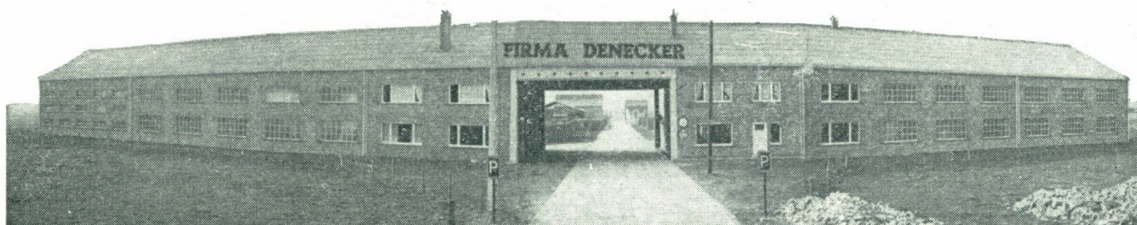
Bedrijfsgebouwen Denecker, bouwmaterialen, op industrieterrein te Diksmuide.

De versnippering van het landbouwareaal in West-Vlaanderen is niet verminderd sinds het begin van deze eeuw, toen zij de verwondering opwekte van de Engelse socioloog Seebohm Rowntree. Een enquête, in 1957 uitgevoerd in het arrondissement Ieper, wees uit dat slechts voor 39 % van de landbouwuitbatingen de percelen in een