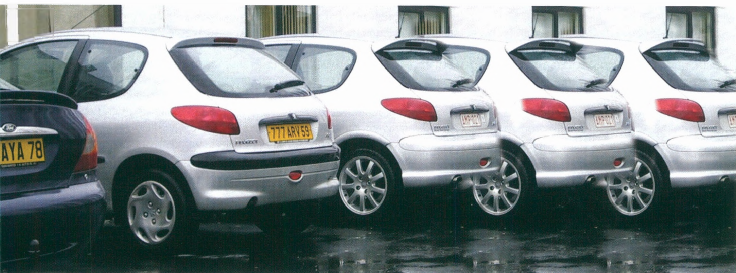
■ Om over de grens te gaan werken, heb je een wagen nodig.

blijkt te zijn voor Fransen om naar België te komen werken, blijkt de financiële benadeling, namelijk lagere lonen (behalve voor hoger geschoold en leidinggevend personeel) en hogere sociale zekerheidsbijdragen van Belgen die naar Frankrijk gaan werken één van de belangrijkste remmende factoren voor de grensarbeid richting Frankrijk te zijn.