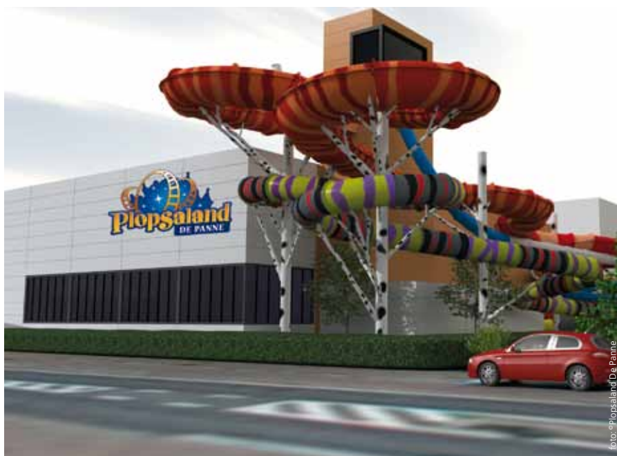
Ontwerpbeeld op te richten subtropisch zwembad