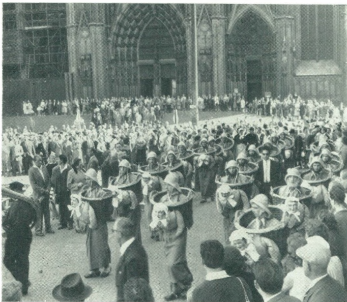
Het optreden van de Blankenbergse vissersgroep vóór de Dom te Keulen op 21 september 1959, ter gelegenheid van de dag van de Belgische kust aldaar.

In twee grootwarenhuizen van Keulen werden toeristische stands geplaatst door Westtoerisme, die een vlotte belangstelling kenden bij de bevolking van Keulen.