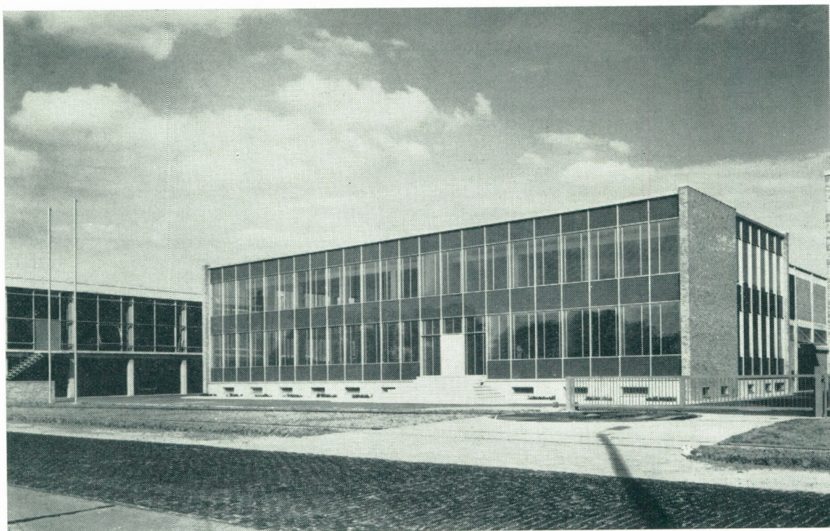
Bedrijfsgebouw Franco-Belge te Brugge (Archit. A. & L. Dujardijn, Brugge)