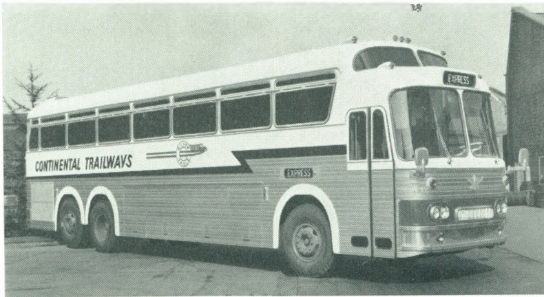
Eerste produkten van «Bus and Car» gebouwd in de «La Brugeoise et Nivelles».

schikte toegangswegen rechtstreeks zal verbonden zijn met de autosnelweg van Oostende.