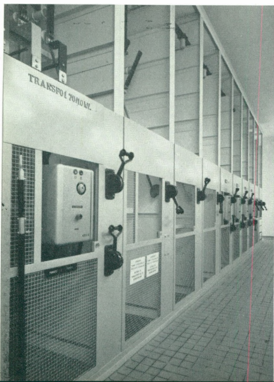
Zicht in de hoogspanningspost te Pittem.

Op woensdagvoormiddag 4 oktober bracht de groep een bezoek aan de haveninstallaties te Zeebrugge.