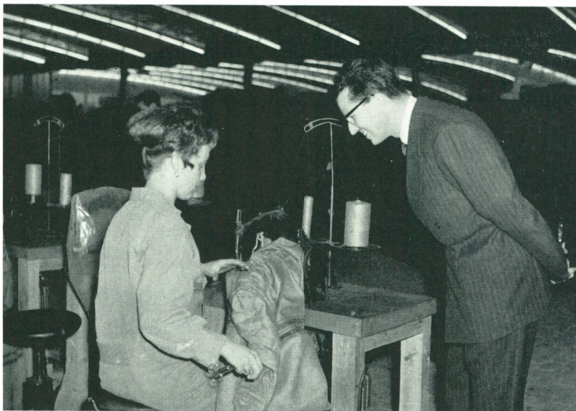
Bezoek van Z.M. Koning Boudewijn aan N.V. Dumont-Wyckhuysse